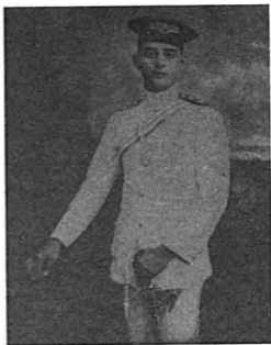
GAMBAR 6 Dato' Onn Ja'afar dalam pakaian seragam pegawai Askar Johor Timbalan Setia Negeri (JMF)