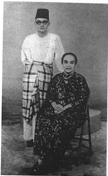
GAMBAR 1 Dato' Onn Ja'afar dan isteri semasa bergiat dalam Pergerakan Melayu Semenanjung Johor dan Pertubuhan Kebangsaan Melayu Bersatu