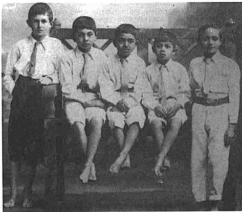
GAMBAR 8 Dato' Onn Ja'afar bersama putera-putera YMM Sultan Ibrahim semasa menuntut di England. Dari kanan Dato' Onn Ja'afar, YTM Tengku Temenggung Ahmad, YTM Tengku Abu Bakar (Tengah Haris Bendahara) dan YTM Tengku Ismail Mahkota (Sultan Ismail)