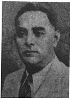
GAMBAR 5 Dato' Onn Ja'afar, Menteri Besar Johor Ke-7 (1947-51)