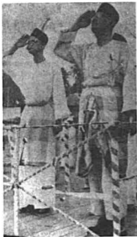
GAMBAR 7 Dato' Onn Ja'afar dan Hussein Onn (Ketua Pemuda PEKEMBAR atau UMNO) sedang membalas tabik kehormatan dari barisan PEKEMBAR