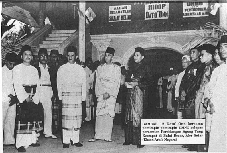
GAMBAR 12 Dato' Onn bersama pemimpin-pemimpin UMNO selepas perasmian Persidangan Agung Yang Keempat di Balai Besar, Alor Setar