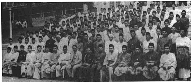
GAMBAR 10 Perwakilan parti-parti politik seluruh Tanah Melayu berhimpun di Istana Besar, Johor Bahru pada hari Sabtu, 11 Mei 1946