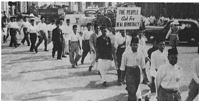
GAMBAR 13 Tuntutan-tuntutan Kemerdekaan di Kuala Lumpur pada Julai 1954