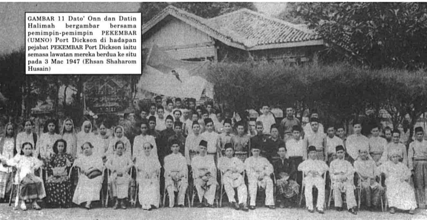
GAMBAR 11 Dato' Onn dan Datin Halimah bergambar bersama pemimpin-pemimpin PEKEMBAR (UMNO) Port Dickson di hadapan pejabat PEKEMBAR Port Dickson iaitu semasa lawatan mereka berdua ke situ pada 3 Mac 1947 (Ehsan Shaharom Husain)