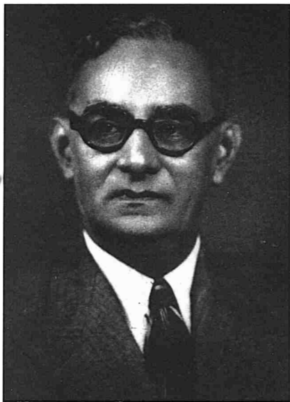
Dato' Onn Ja'afar